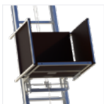
Caisse à matériaux polyvalente