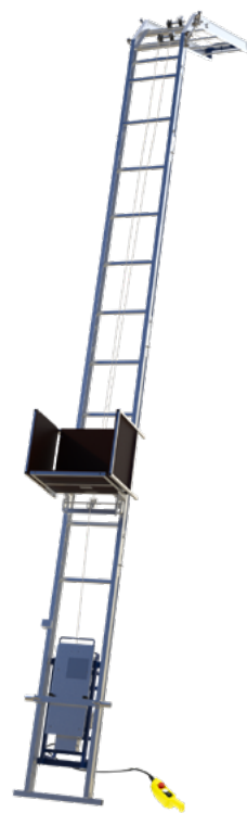
Modèle présenté : 05020011