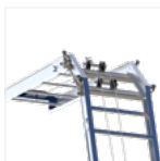
Genouillère Ø à 60°