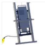
Treuil débrochable à monter sur l'échelle de départ